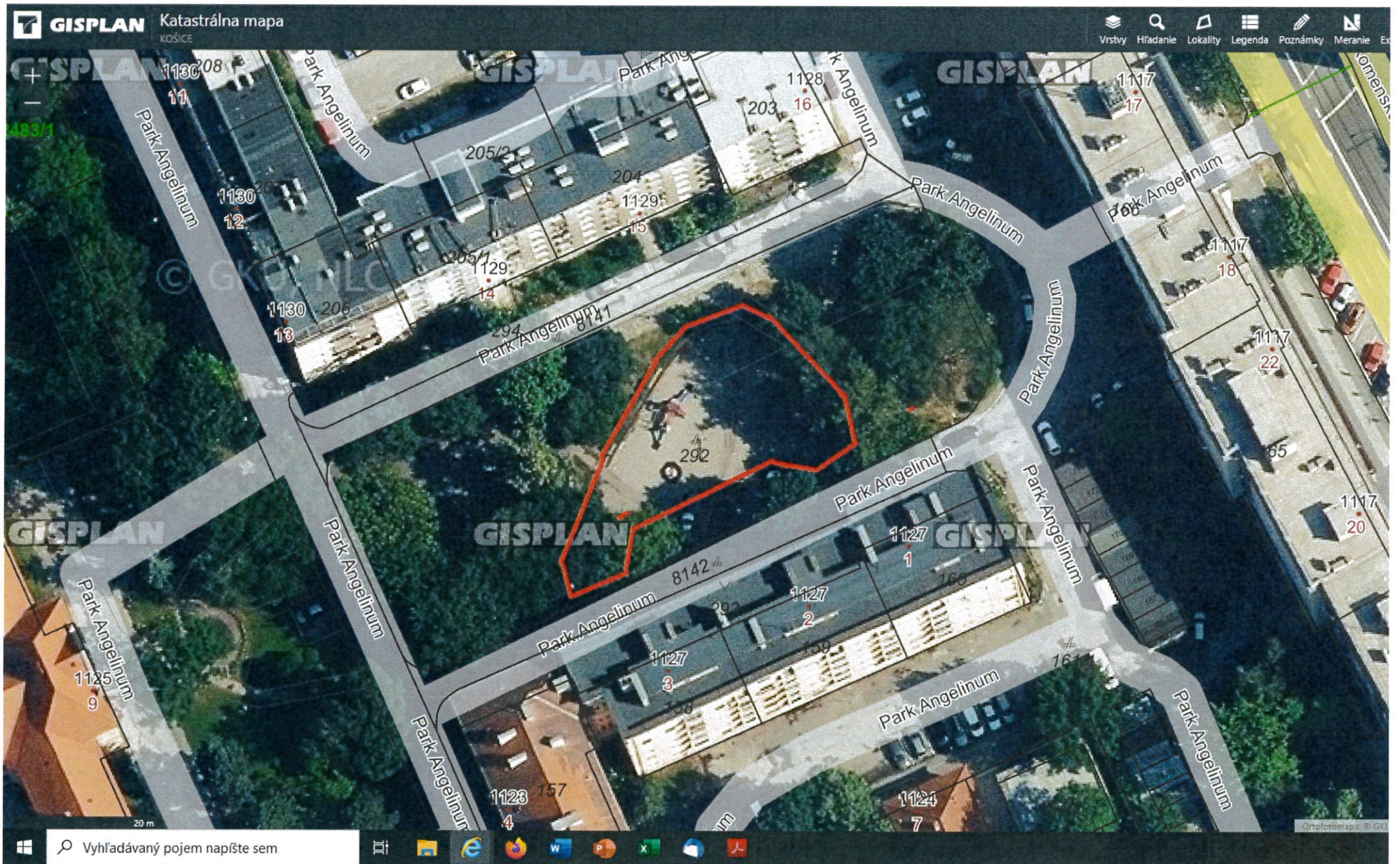
Detské ihrisko Park Angelinum, časť p. č. 292