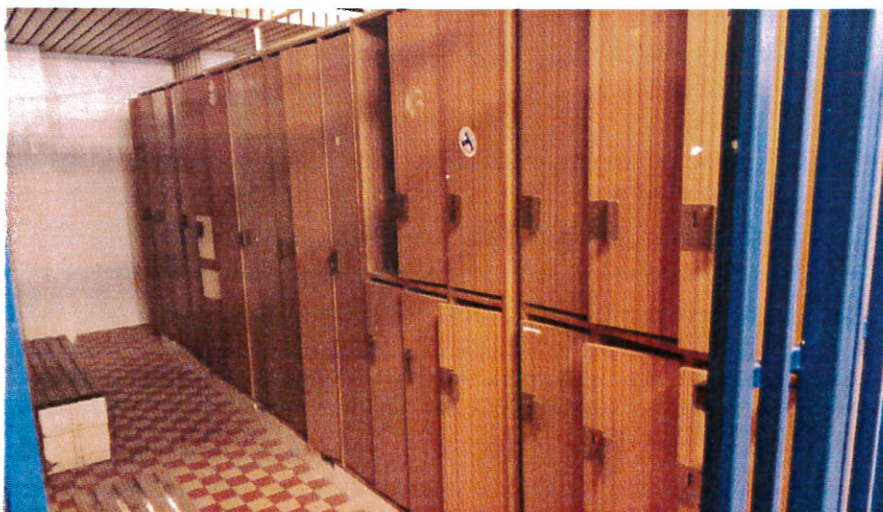
Doplnenie zriaďovacej listiny - Dôvodová správa

Pre potreby uplatnenie si výkonu podpory od Východoslovenskej distribučnej, a. s. vo vzťahu na výrobný zdroj elektrickej energie kogeneračná jednotka podľa podmienok stanovených zákonom číslo 309/2009 Z. z. o podpore obnoviteľných zdrojov energie a vysoko účinnej kombinovanej výroby a o zmene a doplnení niektorých zákonov v znení neskorších predpisov je potrebné rozšíriť činnosť rozpočtovej organizácie o obchodovanie z energiami. Nezanedbateľnou časťou príjmov Mestskej krytej plavárne je prenájom reklamných plôch, ktorý by